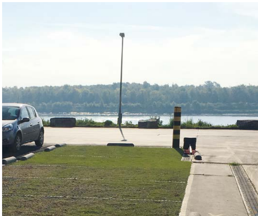
Argex zou het propere water in principe ook naar de Schelde kunnen laten afvloeien.

Dit recent uitgedokterde systeem opent meteen interessante perspectieven, zeker voor de industrie. “Bij ondernemingen die een investering in een rietveld overwegen, zie je af en toe wat twijfel omdat een rietveld toch een behoorlijke oppervlakte inneemt. Niet elke firma beschikt daarvoor over de nodige ruimte. Maar: elk bedrijf beschikt normaal wel over een eigen parking. Als je de waterzuivering onder die parkeerterrein kan aanleggen, sla je twee vliegen in één klap. Dat kunnen er zelfs drie zijn, want sommige ondernemingen beschikken over een zonneparking en kunnen op dezelfde ruimte dus nog eens duurzame energie opwekken.” Uit tests van het project bij Argex bleek dat de resultaten van de Phytoparking gelijkaardig zijn als die bij een belucht rietveld. Toch hoeft dit volgens Dion van Oirschot niet het einde van (beluchte) rietvelden te betekenen. “Zeker niet, beide systemen kunnen perfect naast elkaar bestaan. Door de extra afdekking die vereist is en de grasdallen, is een Phytoparking als investering iets duurder dan een belucht rietveld. Bij bedrijven die over voldoende ruimte beschikken, zal een rietveld dus zeker een optie blijven. De Phytoparking kan je eigenlijk overal integreren: in parkings langs de straatkant bij woonwijken, in de zorgsector, de industrie, kantoren, ... Eigenlijk kunnen we voor elke toepassing een oplossing uitwerken, zelfs voor vrachtwagenparkings. Dan moeten we gewoon een andere dimensionering voor de drukverdelende laag vinden.”