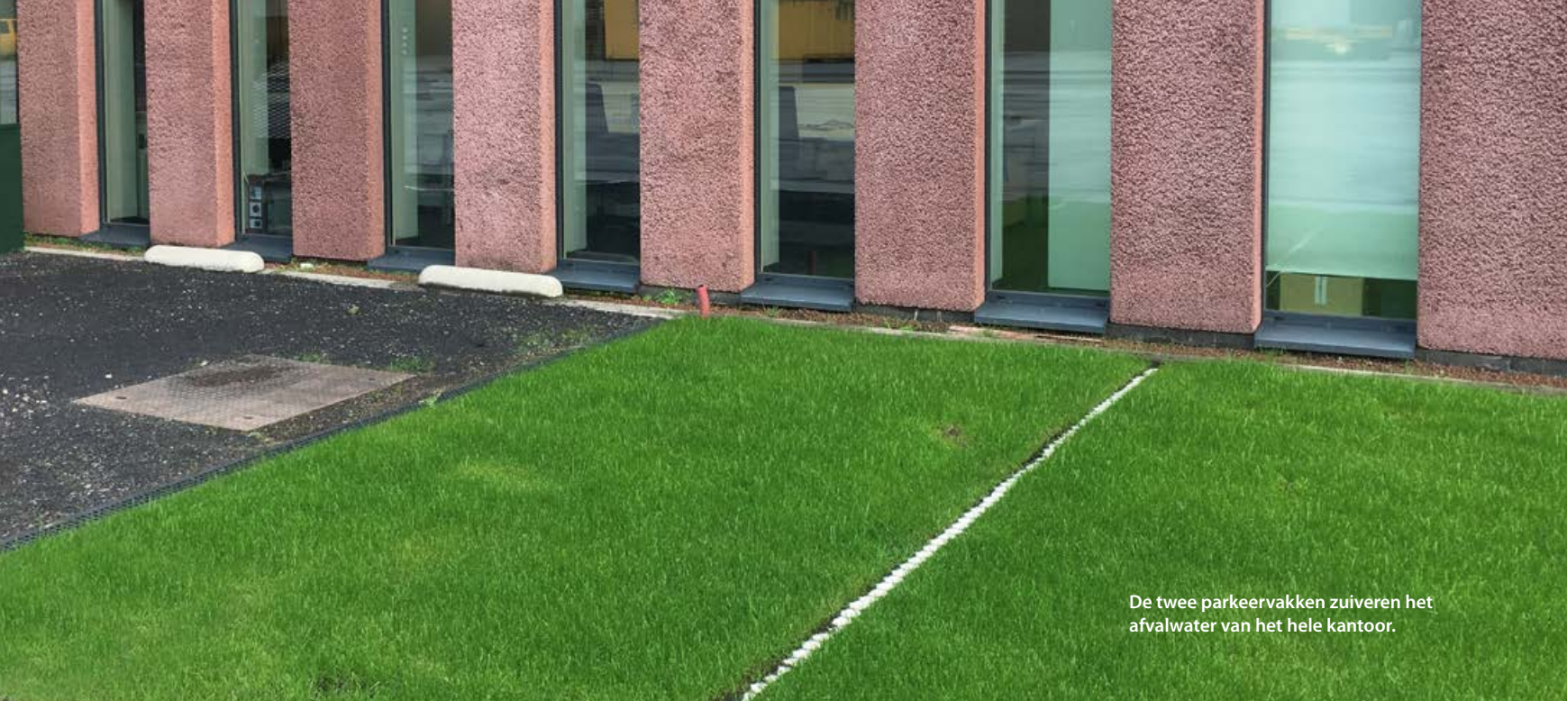
De twee parkeervakken zuiveren het afvalwater van het hele kantoor.